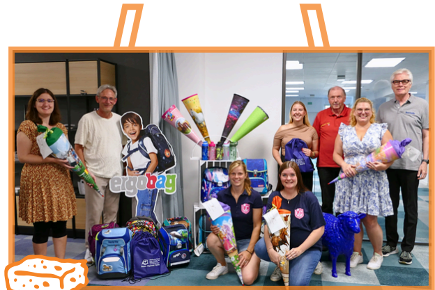
Bild: Übergabe der Schulaktion 2024 bei Bonsels: Tafel-Kinder erhalten Schultüten, Schulranzen und Turnbeutel gespendet von Ladies Circle 20 Dillenburg, Raumausstattung Braun, Bonsels Bürotechnik und Stadtwerke Herborn

Auch in diesem Jahr bastelte und befüllte der Serviceclub Ladies Circle 20 Dillenburg 32 Schultüten zum Schulstart der Dillenburger Tafel-Kinder. Die Ladies organisieren die Schultüten für die Tafel schon mehr als zehn Jahre lang. Die Schultüten wurden natürlich auch befüllt: Der Schulbedarf kam durch eine Großspende der Schmidt GmbH (Mittenaar) zustande, die der Tafel wegen Auflösung der Schreibwaren-Abteilung den Restbestand spendete. Spielwaren und Süßigkeiten wurden von Wächtler Spielwaren, Edeka-Mitsch und der VR Bank Lahn-Dill eG gespendet. Bonsels Bürotechnik beschaffte 25 mit Mäppchen und Turnbeutel befüllte Schulranzen und spendete vier Stück selbst. Raumausstattung Braun spendete acht Schulrucksäcke/-ranzen sowie einige Schultüten. Die restlichen Schulranzen wurden durch eine weitere Geldspende der Ladies finanziert. Auch die Stadtwerke Herborn nehmen seit Jahren mit großem Engagement und gut gefüllten Turnbeuteln (u.a. Frühstücks-dosen und Malbedarf) an der Aktion teil.